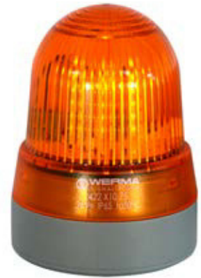
AL 251 – LED/Summer-Kombination Warnlampe orange